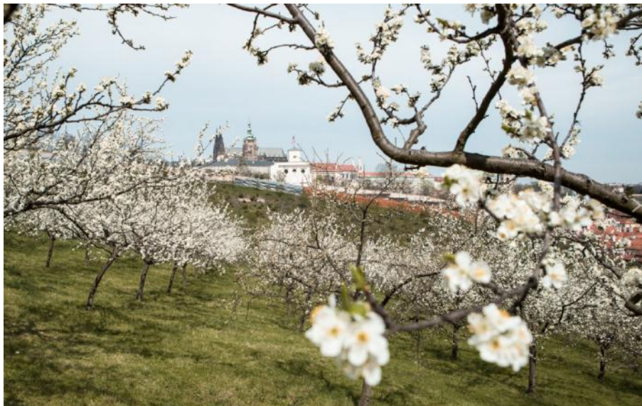
Vista su Praga