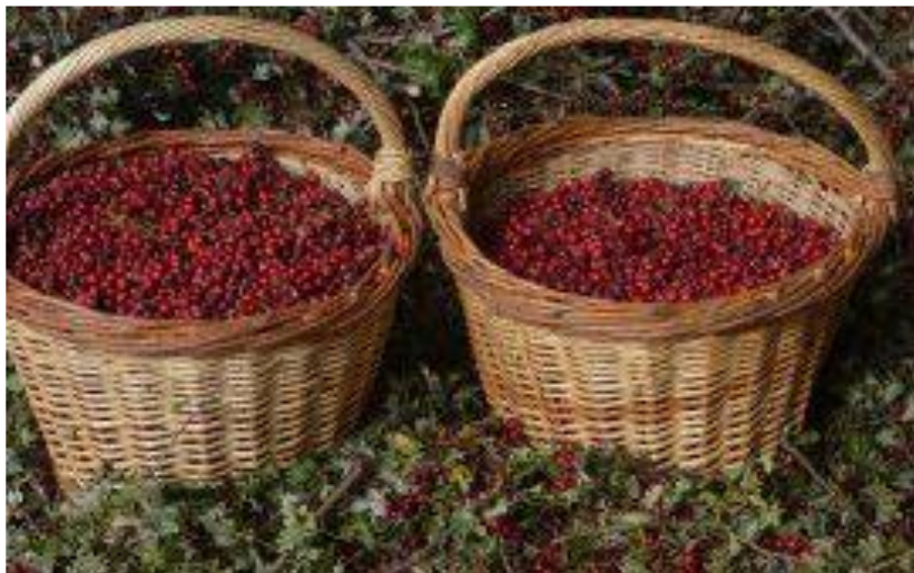
Košare s plodovima gloga ( Crataegus monogyna ) koje su u Francuskoj sakupili članovi udruge AFC.