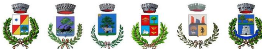
Coat of arms of some municipalities of Sardinia. The cork oak represents the identity element of the community, of the environment and of the rural landscape.

precedentemente indicate, di garantire l'erogazione dei numerosi e importanti servizi ecosistemici forniti dalle foreste di quercia da sughero.