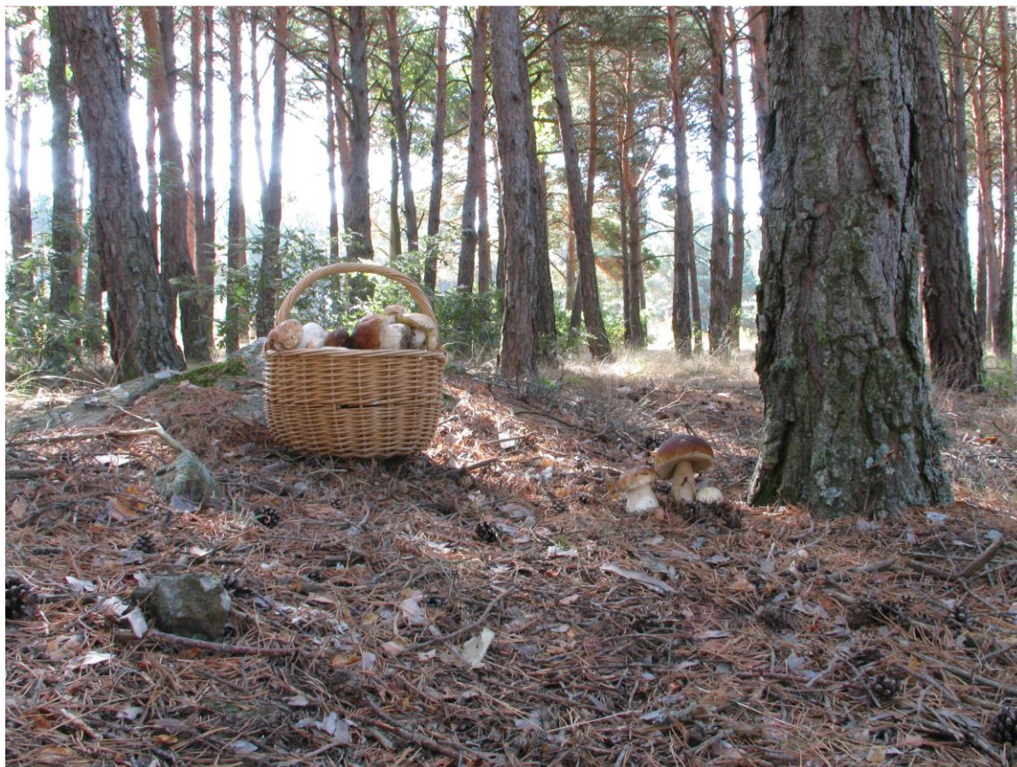
Berba vrganja.